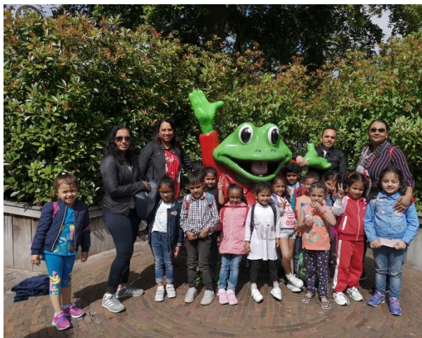
Kleuters op schoolreis