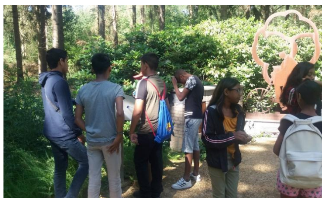
De leerlingen van groep acht op schoolkamp in de Oisterwijkse bossen en heidevelden