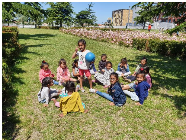
Het grasveld bij het park wordt steeds meer gebruikt zoals hier door de kleuters