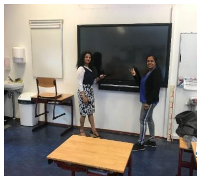
Oude en nieuwe smartboards