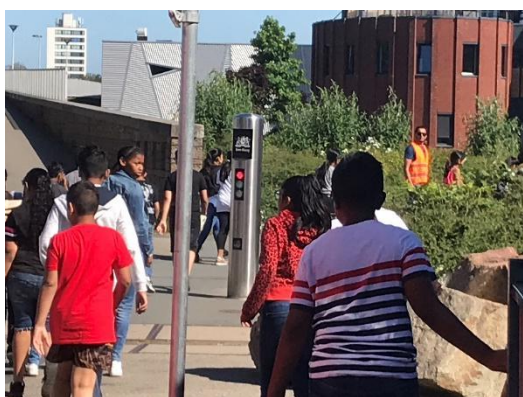
Middenbouwgroepen op weg naar het regentessetheater waar de musical Black and White wordt bijgewoond

De directie werkt met RvT, MR en Ouderraad aan een plan om het busvervoer voor de komende jaren veilig te stellen, voor zo veel mogelijk leerlingen die daar gebruik van willen maken. Wij hopen u vlak voor of na de zomervakantie over de organisatie en de prijs meer te kunnen melden en zullen nog een vragenlijst laten drondgaan bij de ouders. Deze week verstuurt de stichting die het busvervoer regelt de factuur voor het voor de maanden mei, juni en juli.